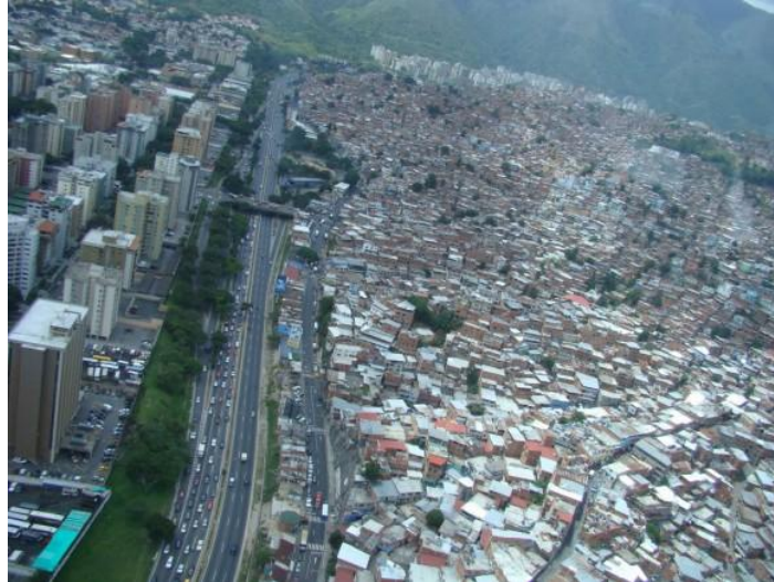
Petare, Caracas, Venezuela