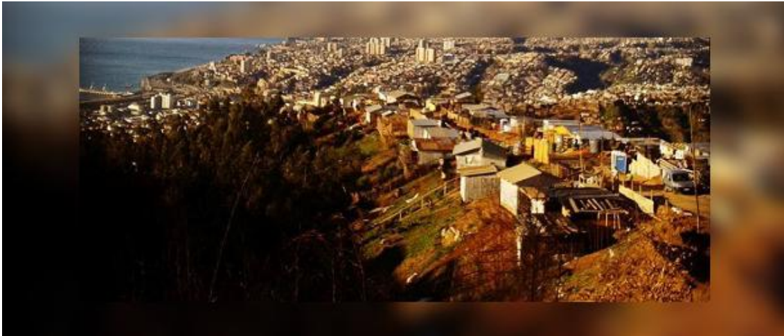
Valparaíso, Chile

Tal y como es posible de estimar en las fotografías anteriores, la ciudad latinoamericana se ha configurado en torno a, por lo menos dos dimensiones de análisis: en primer lugar; el surgimiento de diversas aglomeraciones urbanas segregadas por clase social, generando núcleos de pobreza encapsulados en el crecimiento económico; y en segundo lugar, el surgimiento de nuevos sujetos sociales: el residente en tránsito, aquél que utiliza su ambiente residencial particularmente para actividades de descanso, realizando otro tipo de labores fuera de su barrio o entorno próximo.