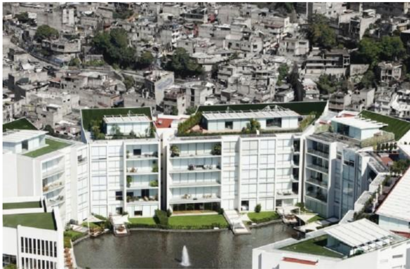
Santa Fé, Ciudad de México ( http://www.plataformaurbana.cl/archive/2014/06/12/segregacion-urbana-en-6-fotos-aereas/ )