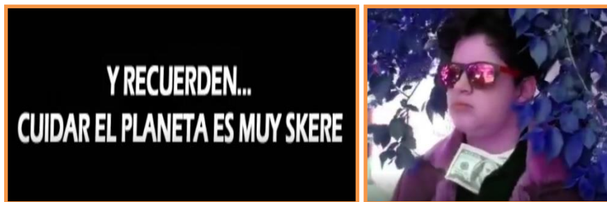
Figura 6. Captura de pantalla del Video N°4. Frase utilizada por los/as estudiantes al finalizar el video. Se traduce skere como "vamos a conseguirlo".