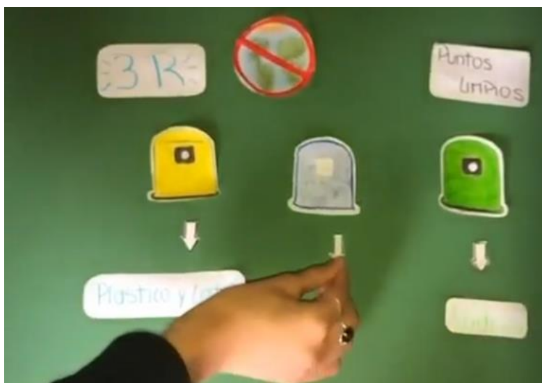
Figura 7. Captura de pantalla del Video N° 5. Explicación de los puntos limpios con dibujos realizadas por los/as estudiantes.