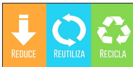
Figura 1. Símbolos representativos de las actividades de reducir, reutilizar y reciclar.

Con el objetivo de recuperar e identificar saberes, se realiza un sondeo de ideas previas a través del interrogante: ¿Conoces la regla de las tres erres? De este modo se pretende que los/as estudiantes aporten sus conocimientos redactando por grupos una definición para los términos reducir, reciclar y reutilizar desde las técnicas o procesos químicos que los involucran a partir de los símbolos que las representan.