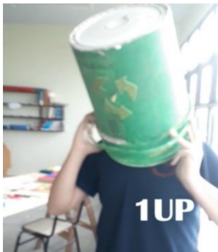
Figura 4. Captura de pantalla del Video N°2. Alumno representando al “superhéroe” del reciclaje” gana una vida (1up).