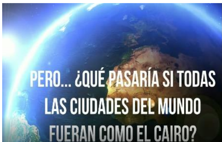
Figura 5. Captura de pantalla del Video N° 3. Interrogante planteado durante la presentación.