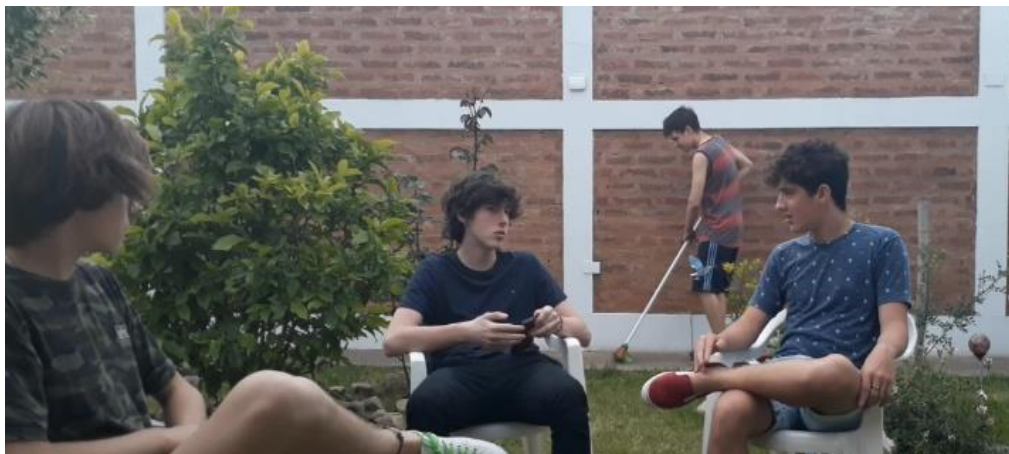
Figura 3. Captura de pantalla del Video N°1. Alumnos siendo entrevistados por el “presentador”.